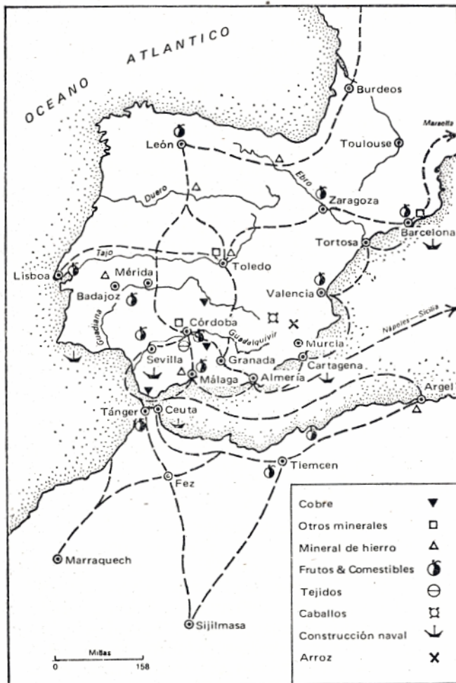
MAPA 2.- PRINCIPALES PRODUCTOS Y RUTAS COMERCIALES DE LA ESPAÑA MEDIEVAL

independencia del gobernante de al-Andalus respecto a toda autoridad política musulmana superior. Para apoyar esta pretensión 'Abd al-Raḥmān III podía alegar su carácter de descendiente de los califas de Damasco; ya desde antes los Omeyas españoles se hacían llamar «hijos de los califas». La reivindicación no se dirigía, pues, contra los 'Abbasīes, sino que se proponía hacer frente a la pretensión de los fāṭimīes y proporcionar a los reyezuelos del norte de África una cierta justificación teológica de la soberanía que debían a los Omeyas de Córdoba.