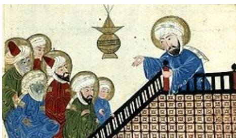
Ilustración del siglo XV de una copia de un manuscrito de Al-Biruni que representa a Mahoma predicando El Corán en La Meca.