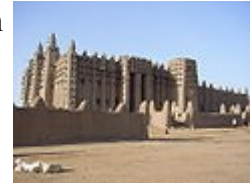
Gran Mezquita de Djenné en Malí es un buen ejemplo del estilo afro-islámico.