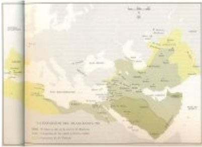
Mapa de expansión del Islam