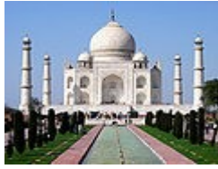
Taj Mahal en Agra, construido por Sha Jahan como mausoleo para su esposa.