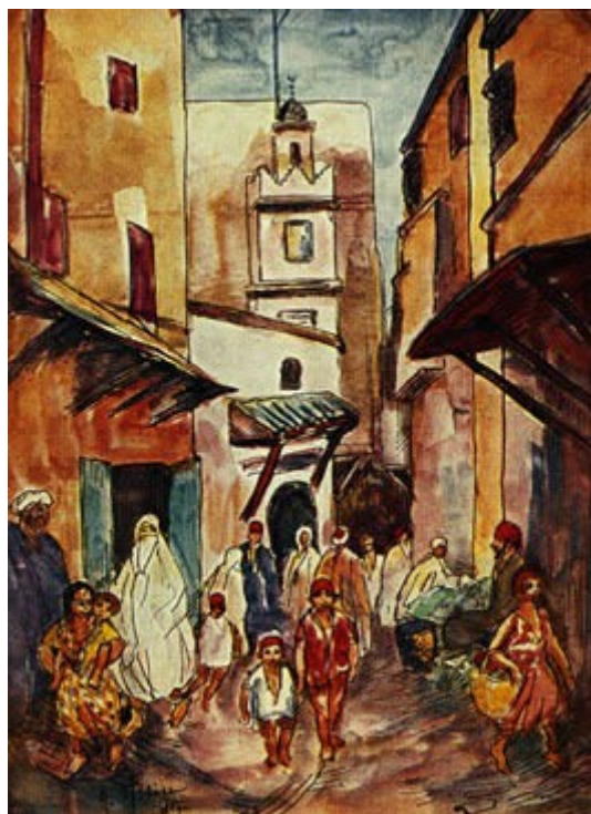
Calle de una ciudad musulmana

Los musulmanes eran tolerantes y no obligaban a convertirse al Islam a los habitantes de las zonas conquistadas.