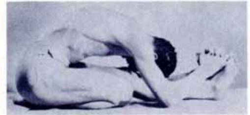
Fig. 3 (left) Fig. 4 (right)