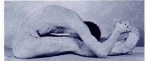
Fig. 5 (left) Fig. 6 (right)