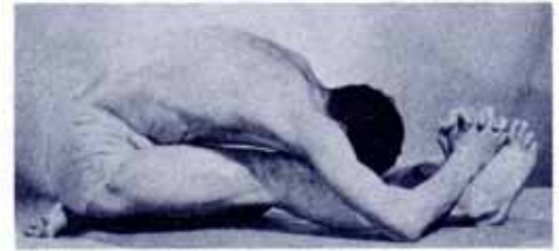
Fig. 1 (left) Fig. 2 (right)