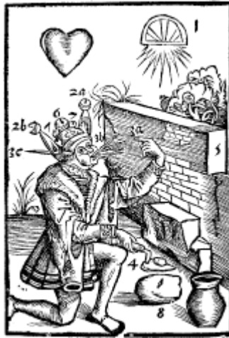
Carta de la memoria de Thomás Murner, 1509.

análoga a los arcanos del naipe, puede estar arreglado sin duda en la categoría de los juegos educativos fundados sobre la tradición clásica y erudita del Arte de la memoria.