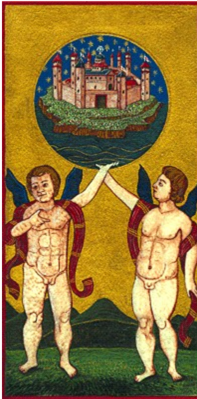
El Arcano XXI (El mundo) del juego dicho sobre "Visconti-Sforza".

Miniatura sobre pergamino según el juego original, por Juan-Miguel Mathonière.