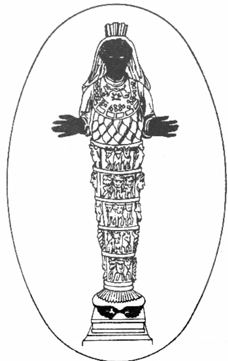
LA VIRGEN DEL MUNDO

Si, entonces, por Perséfone o Koré, la “Virgen del Mundo” se nos enseña a entender el Alma claramente, también se nos enseña claramente a ver en Isis a la Initiatrix o Iluminadora. De la misma manera que Koré, virgen y madre, la egipcia Isis es, en su aspecto filosófico, idéntica a la efesia, la personificación griega de la fructificación y del poderoso nutriente poder de la Naturaleza. Ella era considerada la “inviolable y perpetua Doncella del cielo”; sus sacerdotes eran eunucos, y su imagen en el magnífico templo de Éfeso la representaba. con muchos pechos – πολυμαστη 14 . En las obras de arte Artemis aparece de forma diversa, como la cazadora, acompañada de una jauría, y con los utensilios de