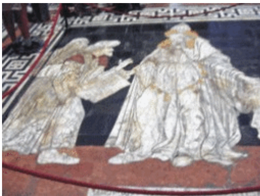
Hermes Trismegisto Mosaico del suelo de la Catedral de Siena