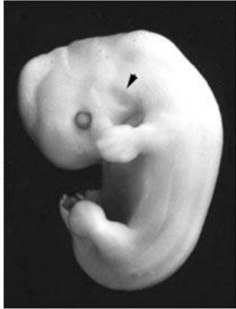
Fig. 6. (Estadio 6). Vista lateral de un embrión prefetal de 19 días de gestación. Formación del pabellón auricular (cabeza de flecha).