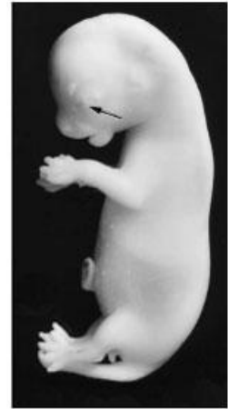
Fig. 9. (Estadio 9). Vista lateral de un feto de 28 días de gestación. Cierre de los párpados (flecha).

EDMON PERRIER narra de manera perfecta la historia de la PALEONTOGENESIS, desde el PROTOZOARIO inicial hasta el VERTEBRADO.