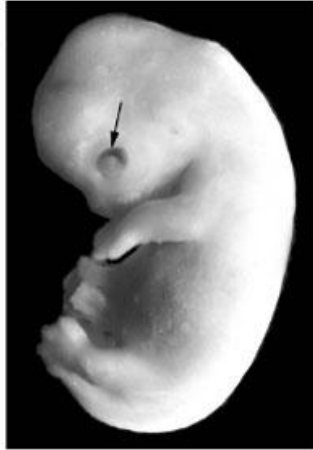
Fig. 7. (Estadio 7). Vista lateral de un embrión prefetal avanzado de 20 días de gestación. Formación de los párpados (flecha).