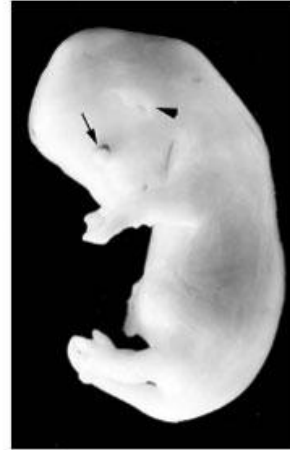
Fig. 8. (Estadio 8) Vista lateral de un embrión prefetal de 24 días de gestación. Párpados (flecha); pabellón auricular (cabeza de flecha).