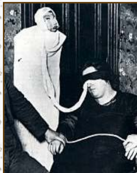
Supuesta materialización de peggy (parece un muñeco)

treinta y cuarenta; viajó por todo el país, realizando sesiones espiritistas en domicilios privados y en iglesias espiritistas. Llegó a convencer a miles de personas de que los muertos podían regresar bajo una apariencia física. Sin embargo, también había escépticos que creían que las materializaciones de Helen Duncan eran un engaño. Se decía que contaba con el espíritu de una niña, «Peggy»; pero en una causa seguida contra Helen en Edimburgo, en mayo de 1933, se afirmó que «Peggy» no era sino un camisón de mujer que una policía consiguió arrebatarse en el transcurso de una sesión. La médium fue hallada culpable de estafa y multada con diez libras.