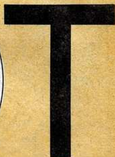
CRUX CAMMISA O DE PATÍBULO