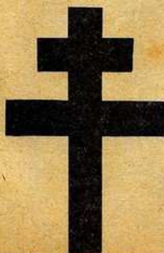
CRUZ DE LORENA

CONOCIDA TAMBIÉN COMO CRUZ DE SAN ANTONIO