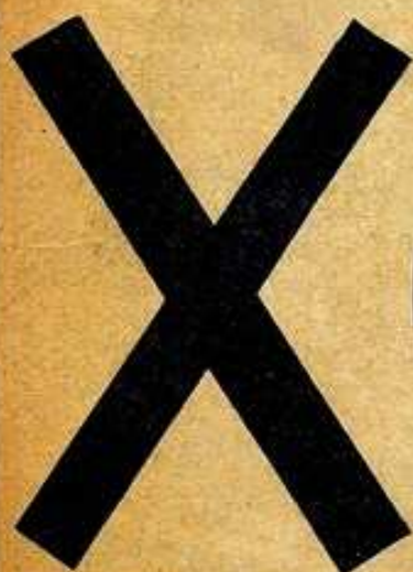
CRUX DECUSATA (DE SAN ANDRÉS)