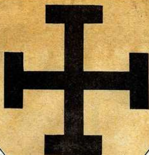
CRUZ DE JERUSALÉN (POTENZADA)