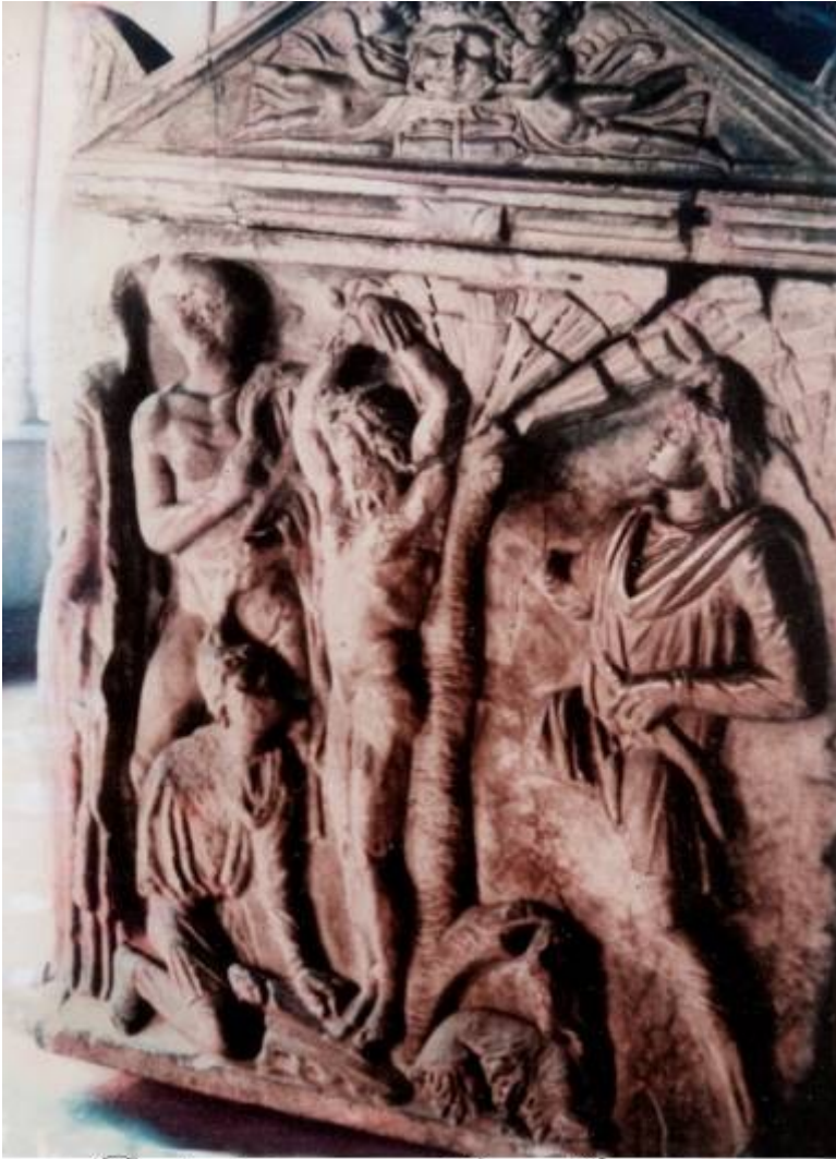
Grabado de nuestro Señor, Jesucristo en el madero, Templo de San Pablo en Roma