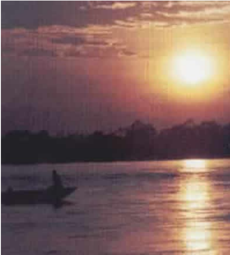
(Río Magdalena, Colombia)

“En 18 de Ilul del año 5404, vulgo 1644, llegó a esta ciudad de Ámsterdam Aharón Levi, y en otro tiempo en España Antonio de Montezinos, y declaró delante de diversas personas de la nación Portuguesa la relación siguiente.