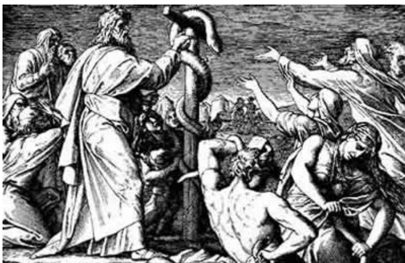
(La Serpiente Kundalini de Moisés levantada en la Tau.)

"Y YHVH dijo á Moisés: Hazte una serpiente ardiente, y ponla sobre la bandera ( Asta, Vara, Enseña ): y será que cualquiera que fuere mordido y mirare á ella, vivirá. (Números, 21: 8. Biblia Reina-Valera.)