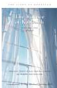
Prefacio a la Ciencia de la Cabalá (Ptija).

Publicado en Diciembre 2, 2008 a las 10:15 pm