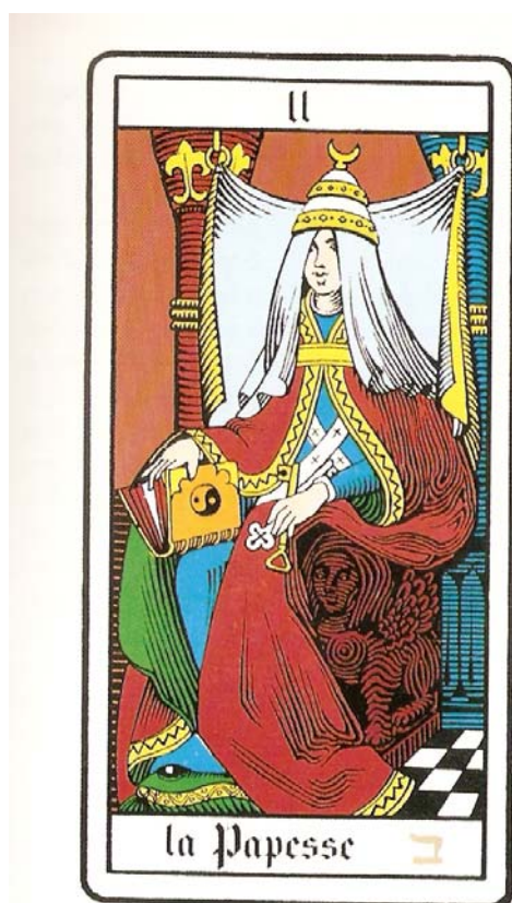
La Papisa - 2ª Carta del Tarot

Estos anacoretas vivían retirados en celdas separadas y se ocupaban como he dicho del estudio de la naturaleza. El SEFER según ellos, compuesto de espíritu y cuerpo: por el cuerpo entendían el significado material de la Lengua Hebrea; por el espíritu, el significado espiritual perdido que no entendía el vulgar. Como se encontraron pues atrapados por las órdenes implacables y autoritarias del Príncipe y por la ley religiosa que les prohibía la comunicación de los misterios divinos, supieron encontrar una solución que les permitió salvar el problema difícil que se les había presentado. Un poco si me permitís , lo que hicieron los Sacerdotes Egiptos con los misterios de Isis encerrándolos en jeroglíficos de las conocidas cartas del tarot, que sólo así han podido llegar a nuestros días. Así pues hicieron una versión verbal tan exacta como pudieron, en la expresión limitada y corporal de la palabra y así evitar los reproches de la profanación, pues dieron sólo el cuerpo de este libro y así obedecieron a la autoridad civil y retuvieron los misterios del espíritu a su propia conciencia. Así pues se sirvieron del texto y de la versión samaritana muchas veces, todas, hasta las que el texto hebreo no les cubría bastante.